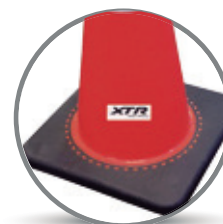
BASE PESADA ANTI-VUELCO