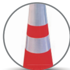
CINTA REFLECTANTE SEGUN NORMA 5.3.1.6